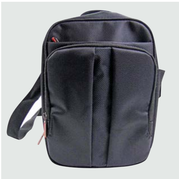
MAL 521 Bandolera Borg ■

Material: Polyester Medida: 25 x 19 x 7 cm.