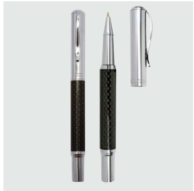
BOL 552 Bolígrafo Mónaco