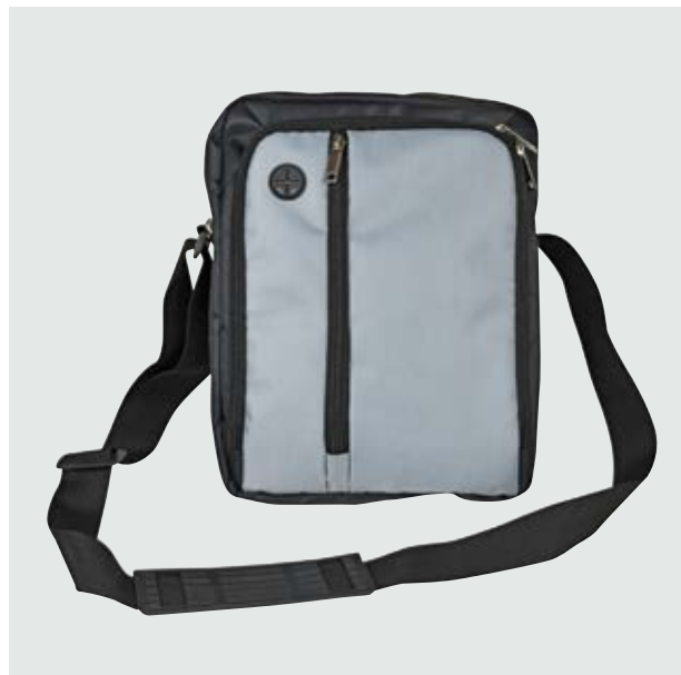
MAL 528 Bandolera Baggio ■

Material: Polyester Medida: 27.5 x 20 x 5.5 cm.