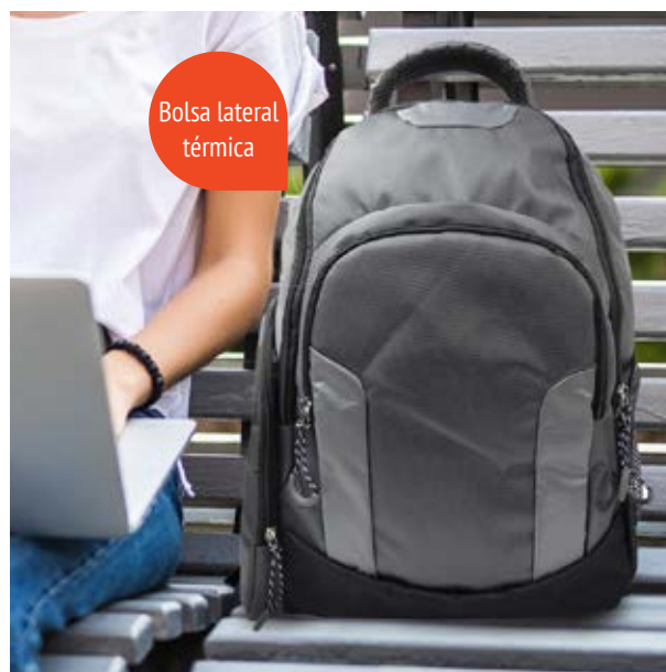
MAL 616 Backpack Sampras