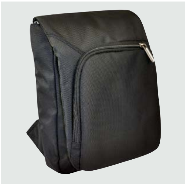
MAL 525 Crossbody Robinson ■

Material: Polyester Medida: 26 x 21.5 x 4.5 cm.