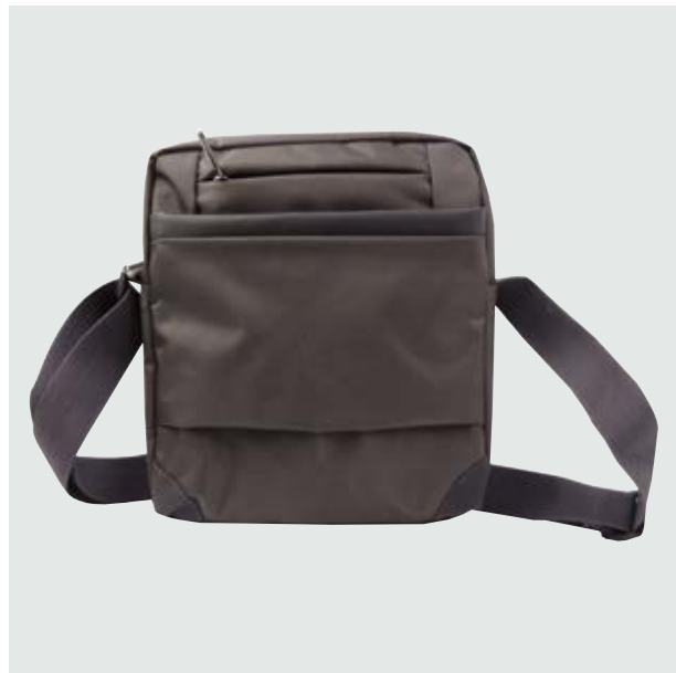
MAL 522 Bandolera Ronaldo ■

Material: Polyester Medida: 25 x 22.5 x 4.5 cm