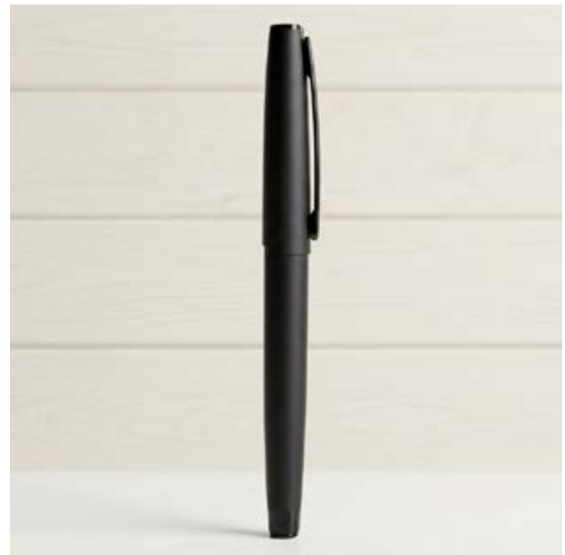
BOL 573 Bolígrafo Top Black